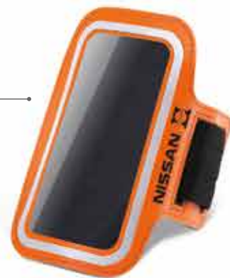
КАРМАН ДЛЯ ТЕЛЕФОНА