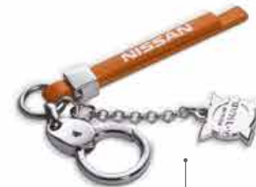
БРЕЛОК С ПОДВЕСКОЙ