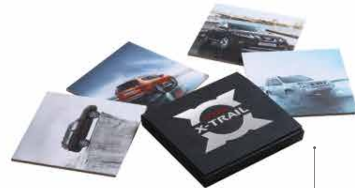
ПОДСТАВКИ ПОД КРУЖКИ