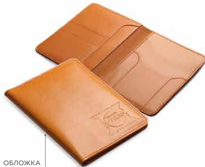
ОБЛОЖКА ДЛЯ ДОКУМЕНТОВ ВОДИТЕЛЯ